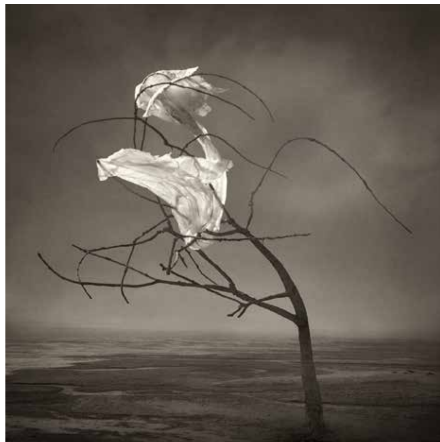
Vento marino 2017, stampa digitale fine art ai pigmenti di colore, 50x50 cm