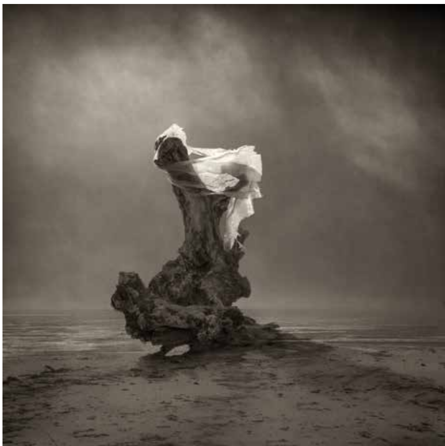
Trasparenze 2017, stampa digitale fine art ai pigmenti di colore, 50x50 cm