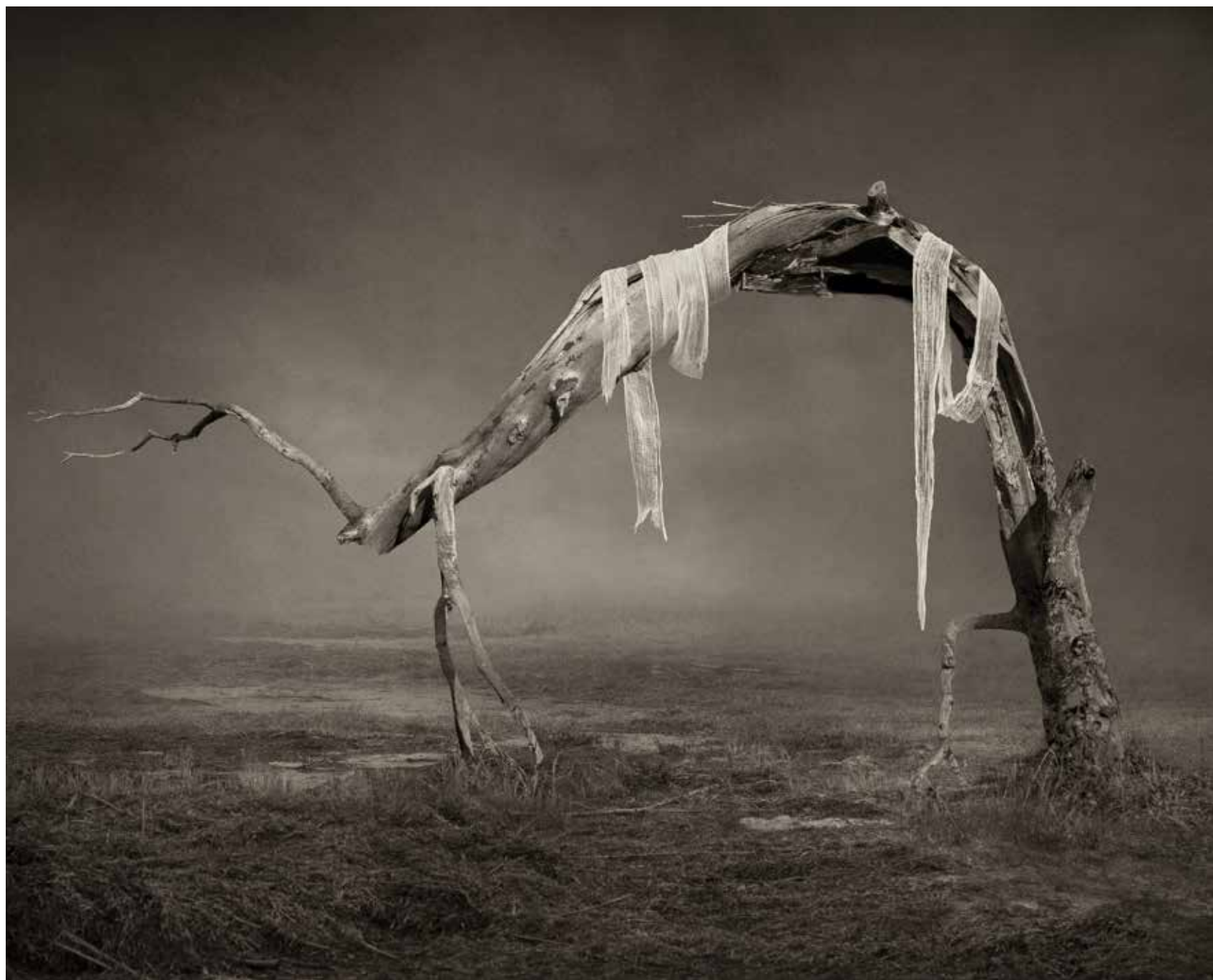
L'albero ferito , 2017 stampa digitale fine art ai pigmenti di colore 80x63 cm